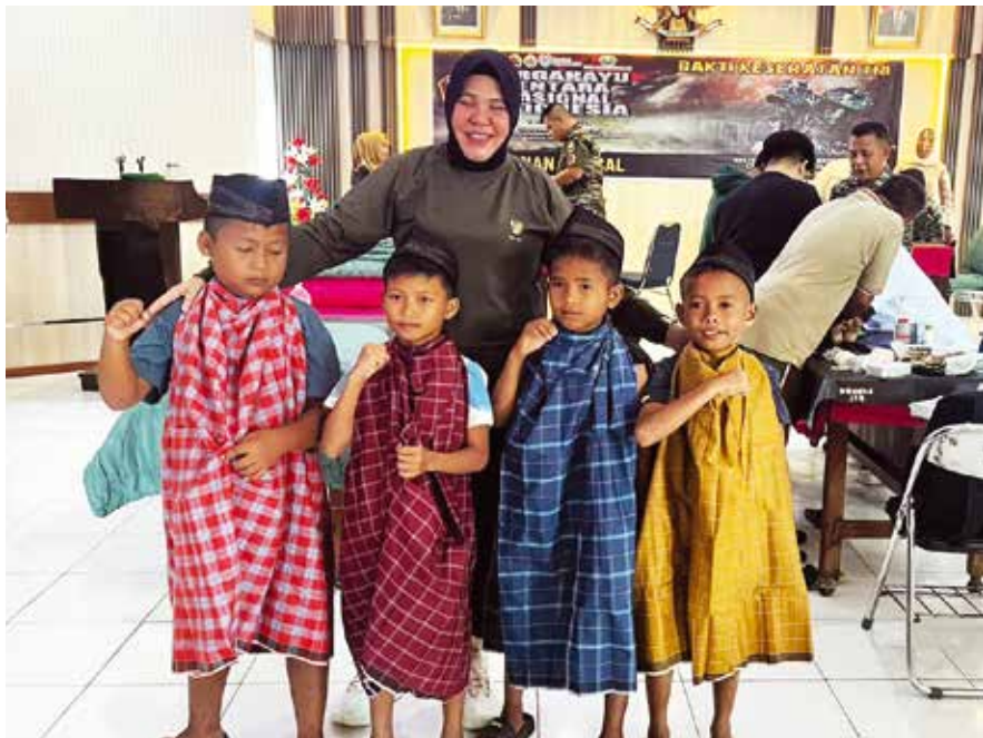
Anak-anak yang akan dikhitan tampak bersemangat dalam kegiatan Bakti Sosial Kesehatan Degeneratif dan Khitan Massal yang dilaksanakan Tzu Chi Padang bersama Kodim 0312/ Padang