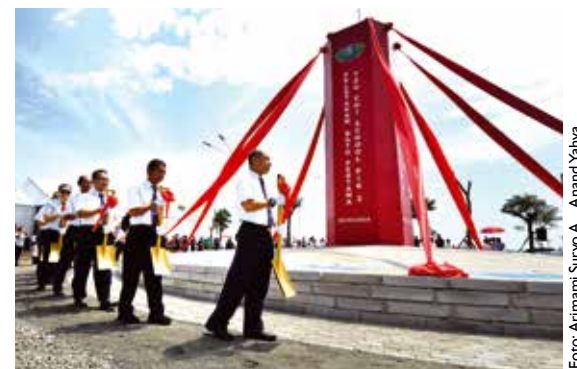
Prosesi Peletakan Batu Pertama Pembangunan Tzu Chi School di kawasan Tzu Chi Education Center PIK 2 juga dihadiri oleh empat Shifu (biksuni) dari Griya Jing Si Hualien, Taiwan, dan relawan Tzu Chi dari Indonesia, Taiwan dan Malaysia.