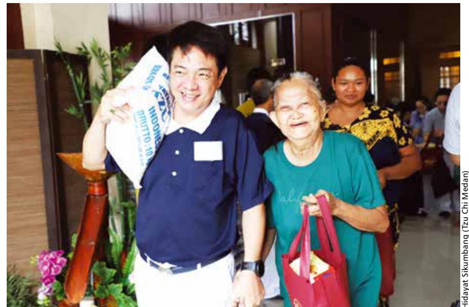
Tzu Chi Tebing Tinggi membagikan kue bulan dan sembako kepada 250 warga kurang mampu. Lewat pembagian kue bulan dan sembako ini, diharapkan masyarakat dapat merayakan festival kue bulan dengan penuh sukacita.