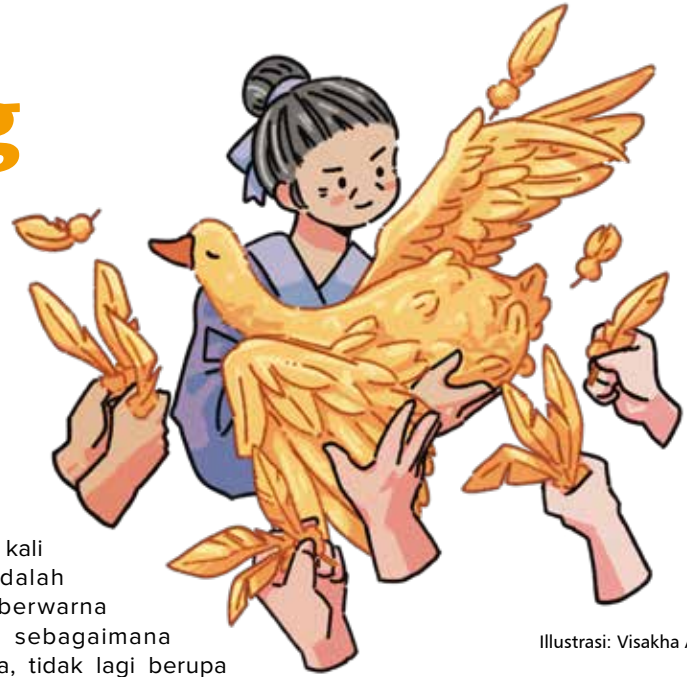
Ilustrasi: Visakha Abhasaradewi

Materi hanyalah sesuatu yang bermanfaat membantu kita menjalani hidup. Jika tidak mampu mengatur dan mengendalikannya, kita akan menjadi orang yang sangat serakah. Hal ini bukan saja membuat perilaku kita lepas kendali, tapi juga mungkin akan memberi kesempatan pada orang lain untuk merusak nama baik kita. Selain itu, kerisauan hati yang tiada habisnya juga akan muncul.