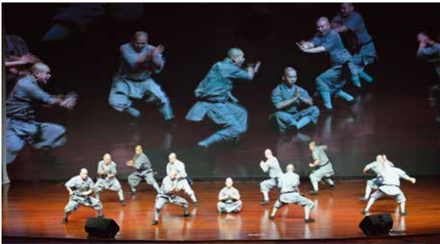
PERTUNJUKAN SHAOLIN DI TZU CHI CENTER (16 SEPTEMBER 2024)

PENAMPILAN 21 PENDEKAR KUNGFU. Para penonton dibuat terpujau dengan keindahan dan kelincahan jurus-jurus seni bela diri shaolin yang ditampilkan di Tzu Chi Center. Kedatangan para pendekar kungfu shaolin dari Henan, Tiongkok ke Indonesia ini juga dalam rangka berziarah bersama para Sangha Sedunia ke Candi Borobudur di Magelang, Jawa Tengah.