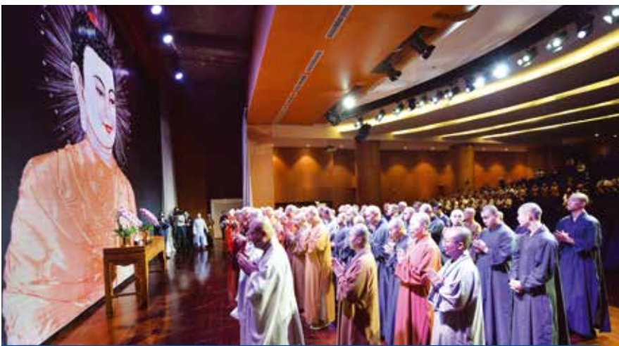
KUNJUNGAN WORLD BUDDHIST SANGHA COUNCIL (20 SEPTEMBER 2024)

DOA SANGHA SEDUNIA. Yayasan Buddha Tzu Chi Indonesia menerima kunjungan dari 113 Bhikkhu Sangha yang tergabung dalam World Buddhist Sangha Council di Tzu Chi Center, PIK, Jakarta Utara. Dalam kunjungan ini, para Sangha diajak untuk melihat sejarah perjalanan Tzu Chi Indonesia di Aula Jing Si serta melaksanakan doa bersama.