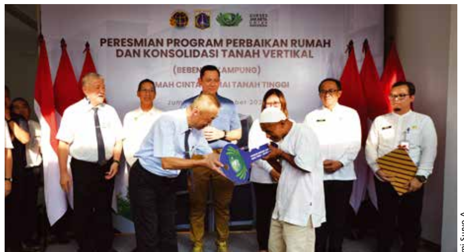
PERESMIAN RUMAH CINTA DAMAI TANAH TINGGI (27 SEPTEMBER 2024)

PENYERAHAN KUNCI DAN SERTIFIKAT TANAH. Tzu Chi Indonesia bersama Pemprov DKI Jakarta, serta Kementerian Agraria dan Tata Ruang/BPN meresmikan Rumah Cinta Damai di Tanah Tinggi, Jakarta Pusat. Rumah Cinta Damai menggunakan model Konsolidasi Tanah Vertikal (KTV) kedua yang dibangun oleh Tzu Chi. Rumah ini terdiri dari empat lantai dengan 12 unit seluas 18 meter persegi yang dihuni oleh 11 keluarga.