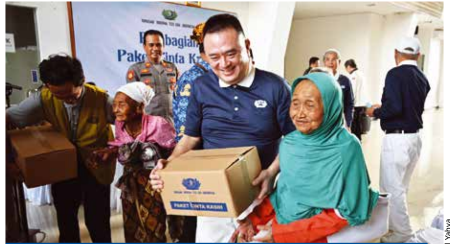
PAKET SEMBAKO UNTUK WARGA BOROBUDUR (17 SEPTEMBER 2024)

PERHATIAN DAN SILATURAHMI. Yayasan Buddha Tzu Chi Indonesia berbagi kebahagiaan dengan memberikan 5.000 paket sembako untuk warga di tujuh kelurahan yang berada di Kecamatan Borobudur, Jawa Tengah. Bantuan ini diberikan untuk meringankan beban ekonomi warga akibat gagal panen, dan menurunnya jumlah wisatawan di saat bukan masa liburan.