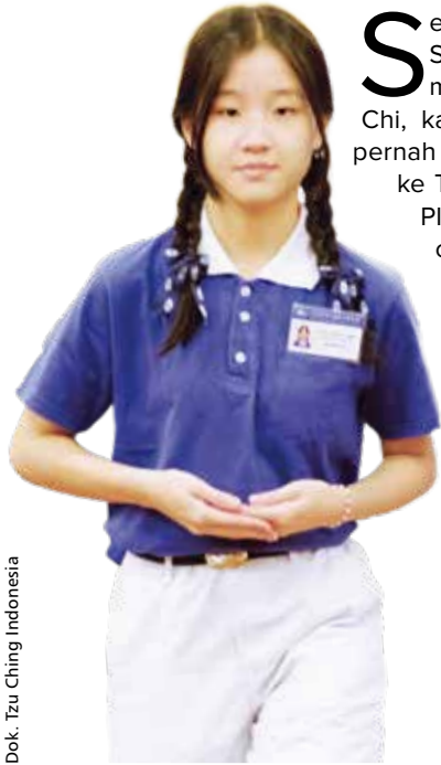
Dok. Tzu Ching Indonesia

Sebenarnya dari SMP saya sudah mengenal Tzu Chi, karena di sekolah pernah ada kunjungan ke Tzu Chi Center di PIK dan penguangan celengan bambu di tahun 2017. Pas kuliah di tahun 2022 ada teman juga yang mengajak ke Depo Pelestarian Tzu Chi, tapi saat itu masih belum tau juga kalau ada Tapi waktu itu belum tau kalau ada Tzu Ching (muda-mudi Tzu Chi) jadi ya menurut