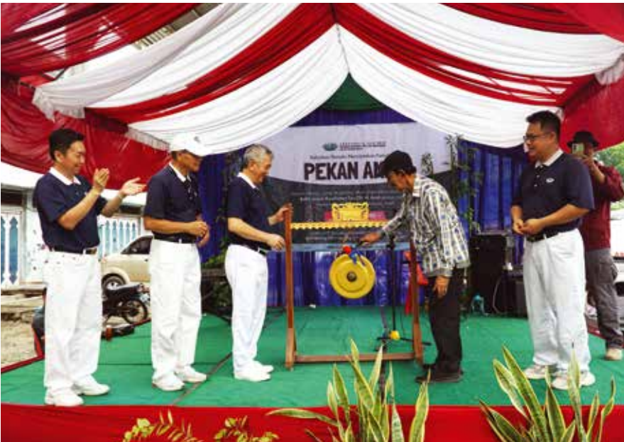
Tzu Chi Aceh mengadakan pekan amal yang menghadirkan 68 stan. Keuntungan bazar akan digunakan untuk mengadakan Bakti Sosial Kesehatan Tzu Chi dalam rangka memperingati 20 tahun Tsunami Aceh.