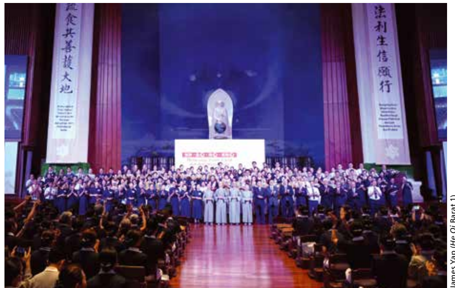
Kehadiran empat Shifu Griya Jing Si Taiwan dan rombongan relawan Taiwan dan Malaysia menjadi berkah tersendiri bagi relawan Tzu Chi Indonesia pada Kamp 4 in 1 yang berlangsung 28-29 September 2024 di Aula Jing Si PIK.

Kesuksesan Kamp 4 in 1 ini juga tak lepas dari 142 panitia yang bekerja di baliknya. Selain relawan komunitas Jakarta dan sekitarnya yang selama ini telah berkontribusi setiap Kamp 4 in 1,